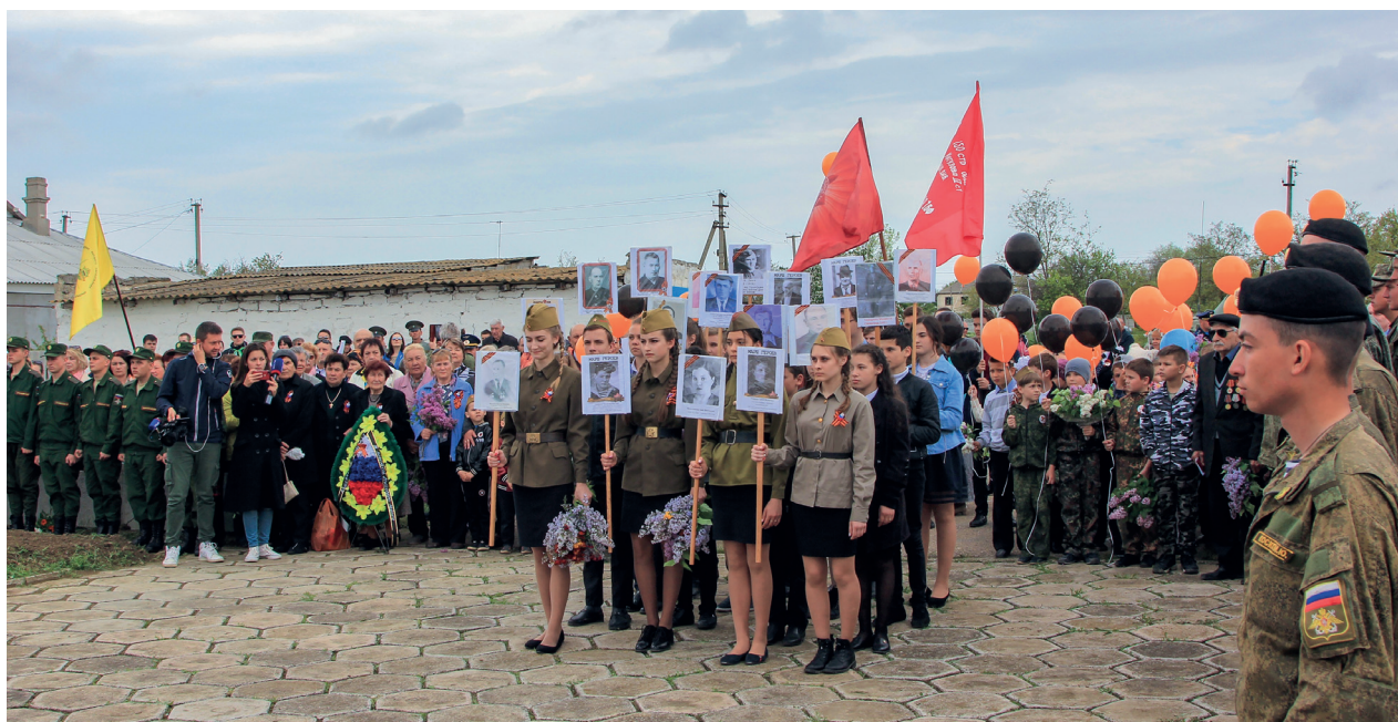
Акция «Бессмертный полк»

Компании и общественными организациями ведут патриотическую, воспитательную, образовательную деятельность среди работников и членов их семей. Видное место корпоративных музеев дочерних обществ занимают экспозиции, посвященные Великой Отечественной войне; на промыслах регулярно организуются передвижные выставки; проводятся уроки мужества в школах территорий присутствия Газпрома; готовятся выставки находок времен Великой Отечественной войны, уголки памяти и боевой славы.