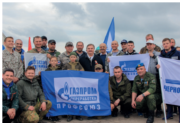
Участники поисковой экспедиции «КРЫМ – ФРОНТ»

Несколько лет «Газпром профсоюз» проводит поисковые экспедиции на территории Республики Крым «КРЫМ – ФРОНТ». За последние годы поисковиками были обнаружены и позже торжественно перезахоронены останки более 80 бойцов и командиров крымских сражений, погибших в боях с января по май 1942 года. Найдены десятки взрывоопасных предметов, которые со всеми необходимыми мерами предосторожности переданы представителям компетентных органов для дальнейшего уничтожения. Это тоже немаловажный аспект – освобождать землю