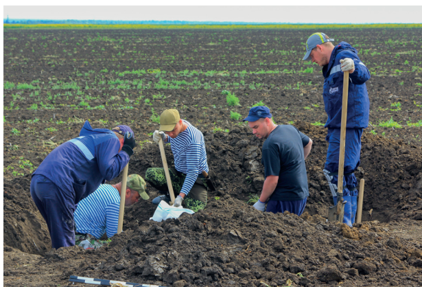
Поисковая экспедиция «Вахта Памяти»

объединить усилия поисковиков и провел круглый стол «Развитие поискового движения в «Газпром профсоюзе»: точки роста». Обменяться опытом, обсудить существующие проблемы и перспективы, выработать единый план действий собрались представители 20 дочерних обществ ПАО «Газпром», в которых развивается поисковое движение. В работе круглого стола приняли участие представители Министерства энергетики Российской Федерации, исполкома Общероссийского общественного гражданско-патриотического движения «Бессмертный полк России», Департамента ПАО «Газпром» (Е.Б. Касьян), работники «Газпром профсоюза». В таком формате и с такой глубиной проработки обсуждение актуальных вопросов прошло впервые. По итогам совещания было принято решение об объединении усилий поисковиков, работающих в предприятиях и организациях ПАО «Газпром», о важности плановой и системной деятельности по всем направлениям поисковой и в целом патриотической работы. Главными задачами такой деятельности должны стать объединение вокруг поисковой работы неравнодушных добровольцев и волонтеров, выработка, реализация, координация плана единых действий всех поисковых отрядов, действующих в дочерних обществах ПАО «Газпром».