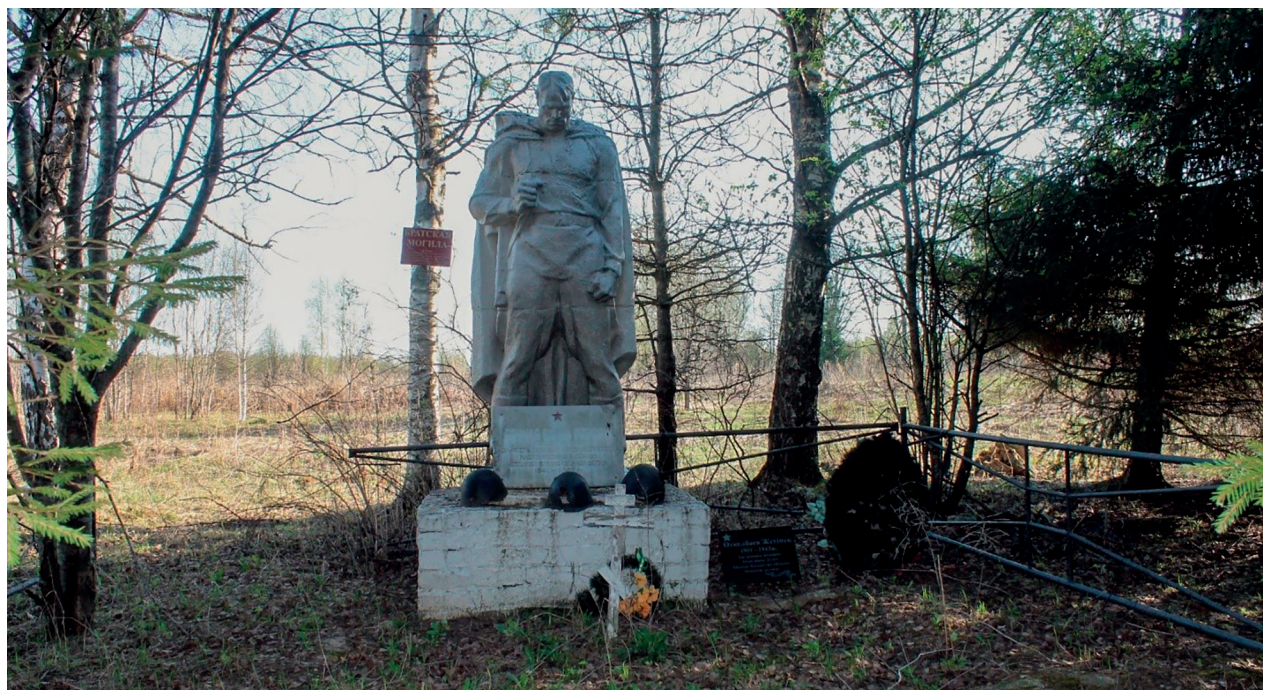
Памятник на братской могиле у д. Урдом

Профсоюзные организации Газпрома вместе с дочерними обществами, поисковыми отрядами